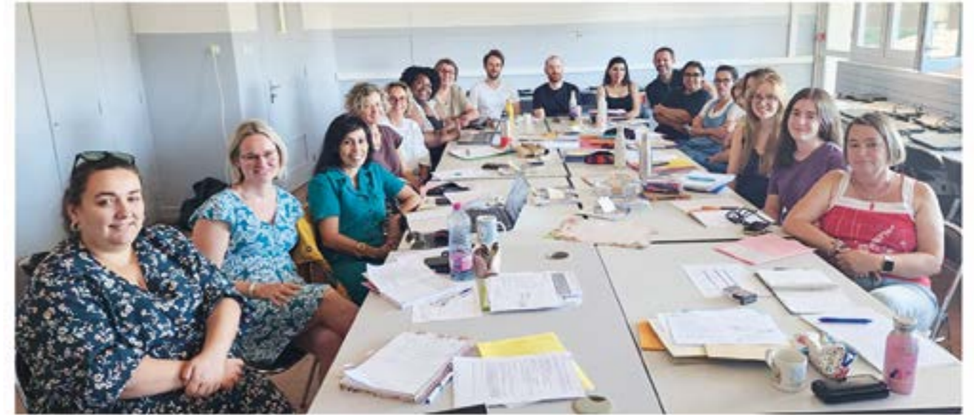
Ecole élémentaire Jacques Prévert 2025/2026