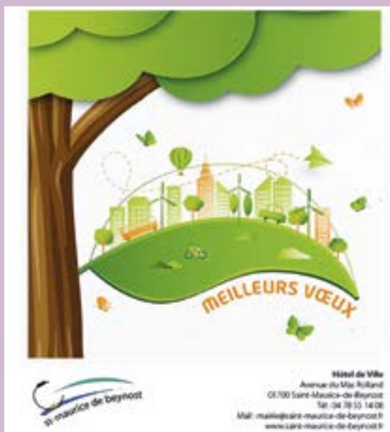
Pierre GOUBET Maire de Saint-Maurice-de-Beynost