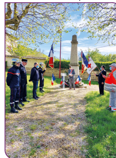
Monument aux Morts, montée de la Paroche

Pour mémoire, le 8 mai 1945 marque la victoire des forces alliées sur l'Allemagne nazie et la fin de la Seconde Guerre Mondiale en Europe.