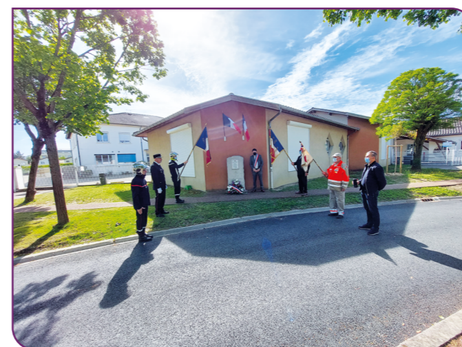
Dépôt de gerbe stèle Charles De Gaulle