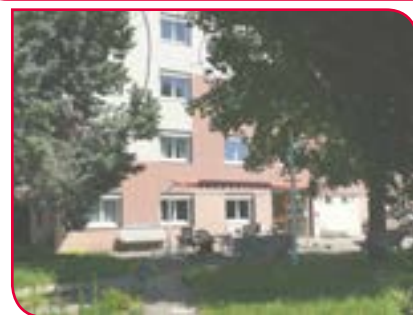
⊙ La Roseraie résidence autonome