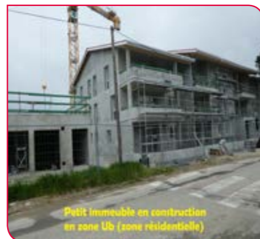
Petit immeuble en construction en zone Ub (zone résidentielle)