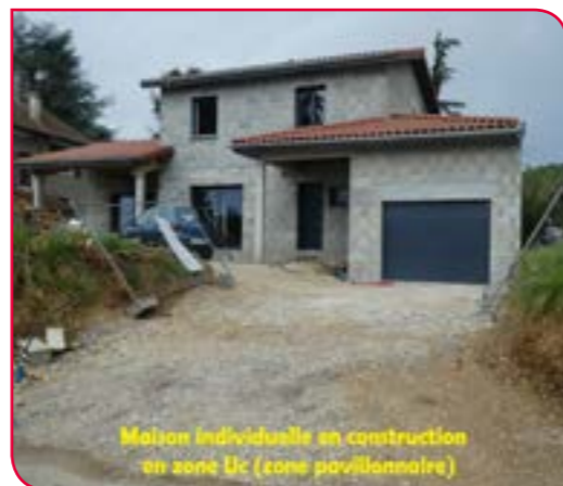
Maison individuelle en construction en zone Ua (zone pavillonnaire)

Afin de respecter les règles et de compléter son dossier, il est préférable de se renseigner auprès du service urbanisme (04 78 55 14 08).