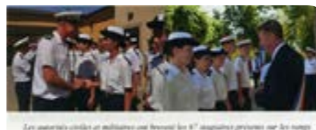
Les stagiaires civils et militaires ont reçu les 17 insignes prévus sur les temps