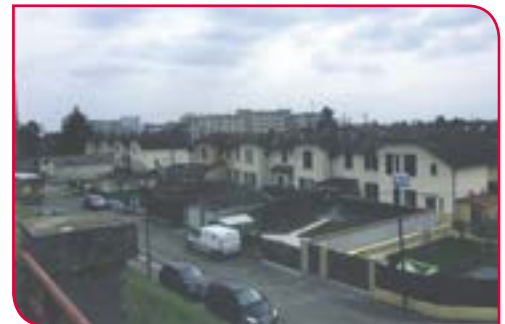
⊙ La cité Toray