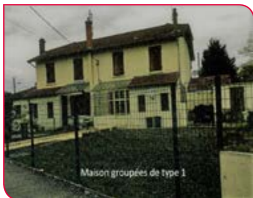
Maison groupées de type 1

Maison groupée type 1, constituée de 4 logements en duplex avec une cuisine, une pièce de vie et deux chambres.