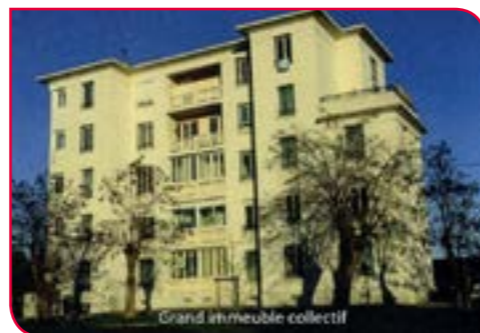
Grand immeuble collectif

Immeuble collectif de 4 étages, ils sont au nombre de 4, implantés de part et d'autre de l'entrée de l'usine, ils proposent alors tout le confort moderne de l'époque.