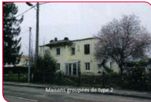
Maison groupées de type 2

Maison groupée type 2, regroupant à l'origine 4 habitations, recouverte d'une toiture plate, elle comportait une terrasse à l'étage. L'avant-corps central est couronné d'un débord de toiture en tuiles canal.