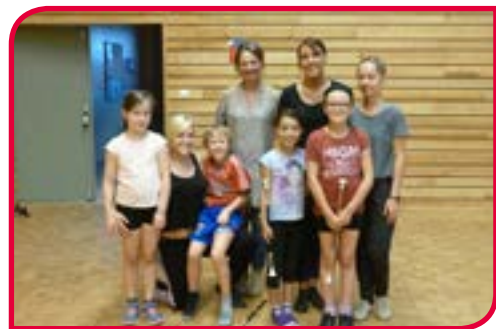
⊙ Une association sportive qui monte : le Twirling Bâton