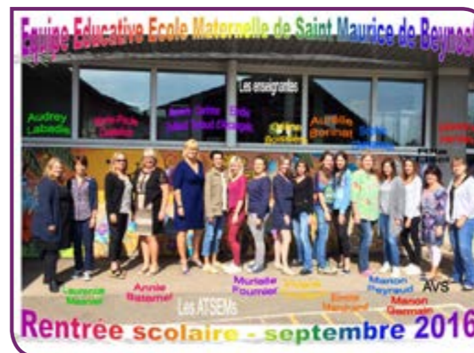
Equipe Educative Ecole Maternelle de Saint Maurice de Beynost Rentrée scolaire - septembre 2016