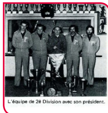
L'équipe de 2è Division avec son président.