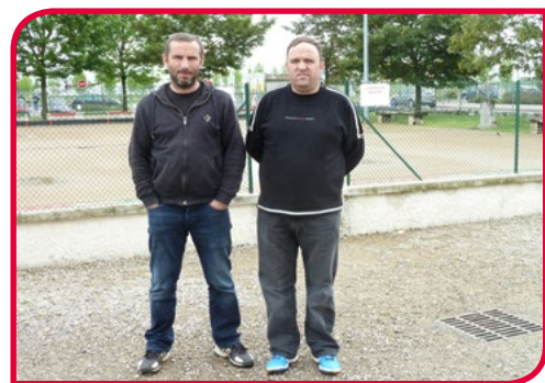
© O.B.S.M, un club qui évolue avec la commune