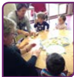
Atelier «sablés» à l'EAJE

Ce fut l'occasion de découvrir, de goûter des épices et de se rencontrer avec les bénévoles d'ARTEMIS et du Club Amitié Loisirs.