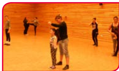
Le Twirling Bâton