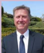
Le Maire, Pierre GOUBET

Dans une société où chaque individu se sédentarise un peu plus chaque jour, il est capital de proposer à toutes les tranches d'âges de bouger plus au quotidien et c'est ce que nous faisons.