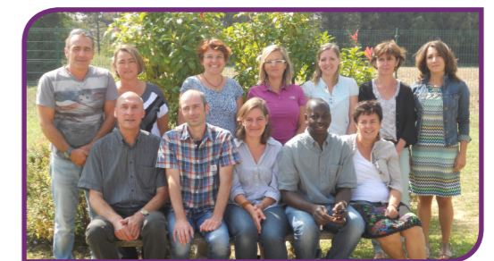
L'équipe enseignante école élémentaire J. Prévert

La réforme des rythmes scolaires est mise en place. Une évaluation à la fin du premier trimestre sera nécessaire pour évaluer les premiers bénéfices sur les apprentissages des élèves.