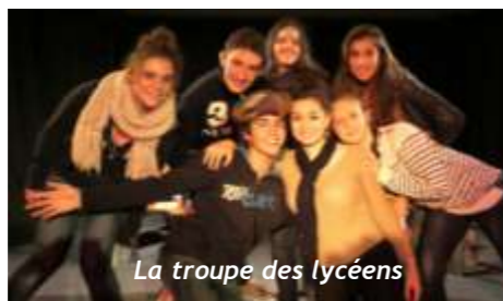
La troupe des lycéens