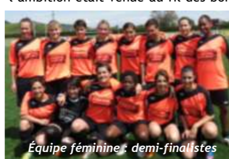
Équipe féminine : demi-finalistes

Beaucoup de satisfaction du côté du club de foot de la CCMP mais une déception : longtemps en tête du championnat honneur l'équipe fanion a raté d'un point la montée en CFA 2. Même si l'objectif était le maintien, l'ambition était venue au fil des bons résultats. Le vrai faux pas est celui de l'équipe réserve qui a longtemps figuré dans le quarté de tête pour finalement être reléguée en PHR au goal average lors de la dernière rencontre.