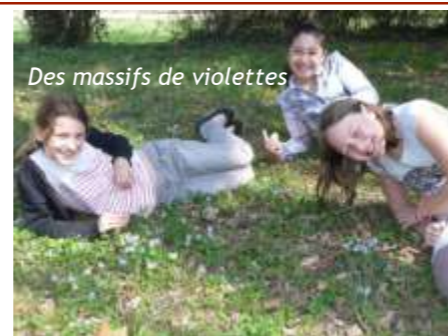
Des massifs de violettes