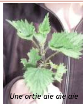
Une ortie aïe aïe aïe