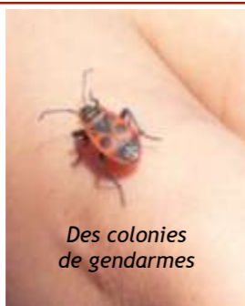
Des colonies de gendarmes