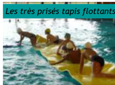
Les très prisés tapis flottants