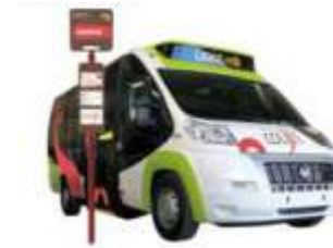
8 bus 63 arrêts 1 carte de voyage

COLIBRI Un réseau bus pour répondre aux enjeux d'aujourd'hui