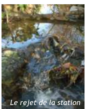
Le rejet de la station

La station d'épuration est chargée d'éliminer la majeure partie des polluants émis par la population, les artisans, les commerçants ou les industriels, afin de rejeter à la Sereine une eau épurée acceptable par la rivière.