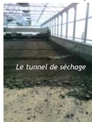
Le tunnel de séchage

Les boues sont alors épandues sous un tunnel de séchage.