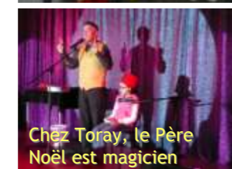
Chez Toray, le Père Noël est magicien