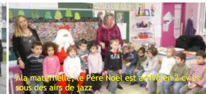
À la maternelle, le Père Noël est arrivé en 2 cv et sous des airs de jazz