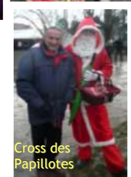
Cross des Papillotes