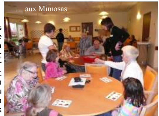
... aux Mimosas