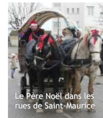
Le Père Noël dans les rues de Saint-Maurice