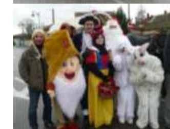
SAINT-MAURICE EN FÊTE POUR NOËL