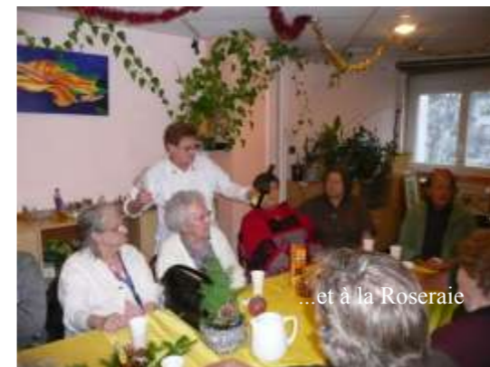
... et à la Roseraie