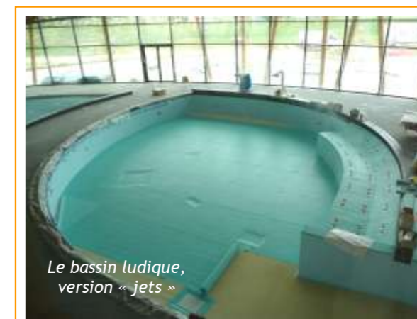
Le bassin ludique, version « jets »