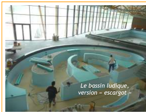
Le bassin ludique, version « escargot »