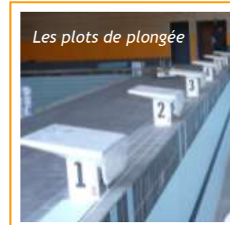
Les plots de plongée