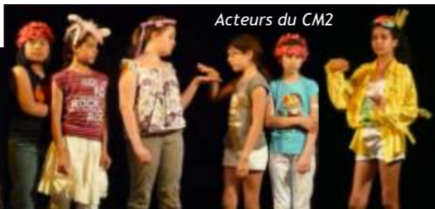
Acteurs du CM2

Soirée spéciale Théâtre : la grande salle des Mimosas, l'Ehpad de la montée de la Paroche, était archicomble, les pensionnaires accueillent leurs voisins miribelans pour une représentation exceptionnelle de « l'Enquête à Bonbons ». Dans un décor reconstitué par Nadège, l'animatrice de la maison, les jeunes acteurs du Centre Marcel Cochet ont partagé un après midi drôle et animé lors d'une rencontre inter générationnelle très réussie.