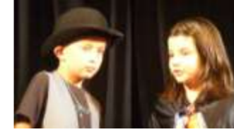
Les plus jeunes

Dans le cadre du Contrat Educatif Local, plus de 120 jeunes mauriciens, de 6 à 16 ans, sont montés sur les planches. Depuis mi mai jusqu'aux dernières heures de juin, le Centre Marcel Cochet et l'école Jacques Prévert se sont mobilisés