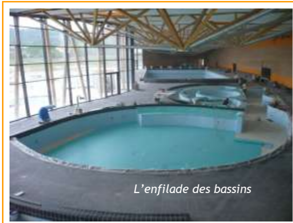
L'enfilade des bassins