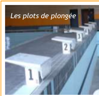
Les plots de plongée