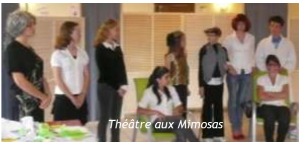
Théâtre aux Mimosas