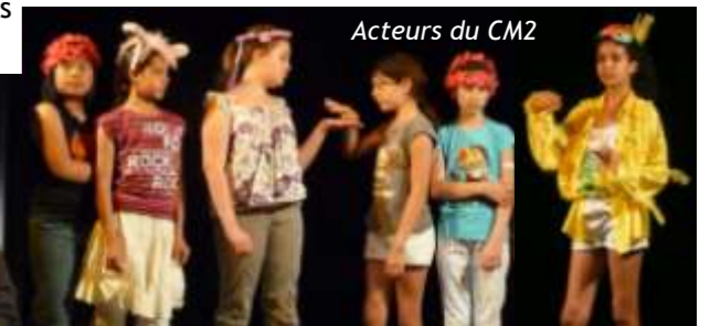
Acteurs du CM2