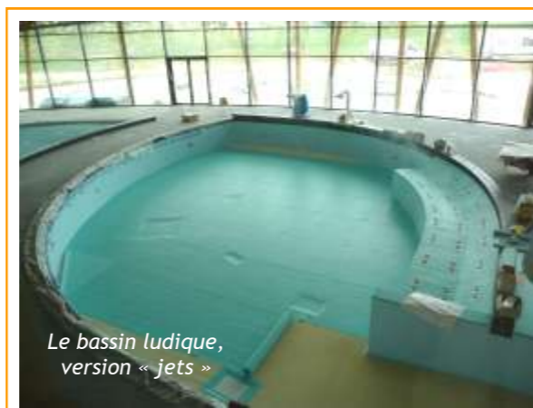
Le bassin ludique, version « jets »