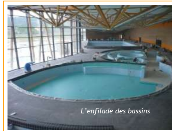
L'enfilade des bassins