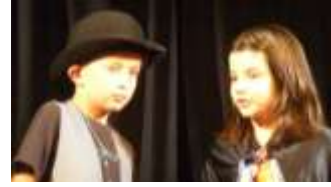
Les plus jeunes

Dans le cadre du Contrat Educatif Local, plus de 120 jeunes mauriciens, de 6 à 16 ans, sont montés sur les planches. Depuis mi mai jusqu'aux dernières heures de juin, le Centre Marcel Cochet et l'école Jacques Prévert se sont mobilisés