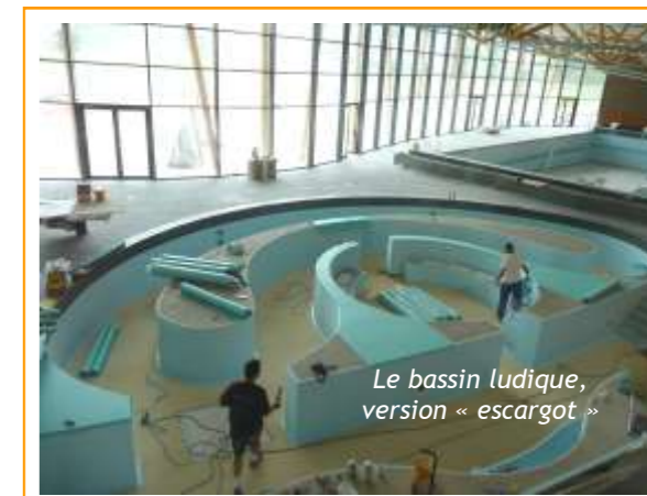
Le bassin ludique, version « escargot »