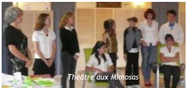
Théâtre aux Mimosas