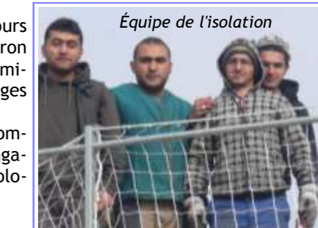
Équipe de l'isolation