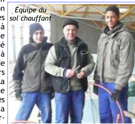
Équipe du sol chauffant

Côté extérieur les buttes qui séparent le complexe nautique de la voie ferrée ont été engagées. L'arrivée du printemps devrait les colorier de vert..... Affaire à suivre.