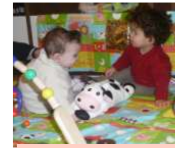
Premières amours !

La seconde édition de « Premières Pages » a tenu toutes ses promesses. Il s'agit d'une opération initiée par le Ministère de la Culture et relayée dans les 6 départements choisis par la CAF et le Conseil Général. Le ministère offre à chacun des enfants né ou adopté en