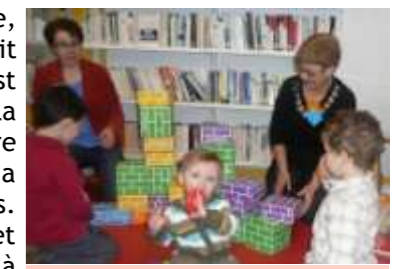
Livres en 3D