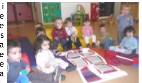
Contes à la Crèche