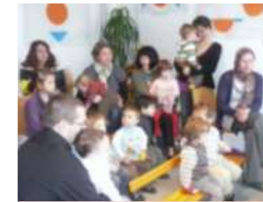
Contes à la bibliothèque

2010 un livre et un guide de lecture, le Conseil Général de l' Ain y ajoute une bibliographie de livres pour tout petit et la Direction de la Lecture Publique propose des malles de livres et des outils d'animation aux bibliothèques et structures d'accueil de jeunes enfants qui le souhaitent. C'est en effet conjointement que Bibliothèque Crèche et Relais animent cette remise de livres. Pour mettre en valeur l'ouvrage « Mercredi » d'Anne Bertier, Claire les doigts de fée du Centre Marcel Cochet a mis en exposition chacune des pages du livre. Les 25 panneaux « orange et bleu » ont séduit bien au-delà du