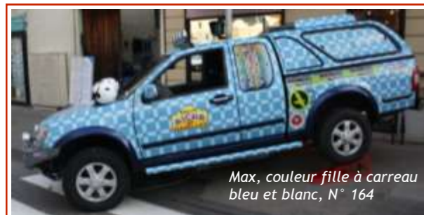
Max, couleur fille à carreau bleu et blanc, N° 164

du Véhicule, Amal et son mari ont pu l'aménager spécifiquement pour la compétition : rehaussé de 12 cm, il bénéficie d'une protection moteur adapté, les tuyaux d'échappement ont été modifiés et placés hors ensablement. Max est chaussé de pneus 245x75x16 spécial rallye. Sièges baquet, harnais de sécurité sur mesure et arceaux de sécurité. Le Père Noël a apporté à Amal un compresseur, un terratrips (pour compter les km), des lampes frontales et un compas de relèvement. Il portera le numéro 164.