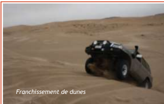
Franchissement de dunes