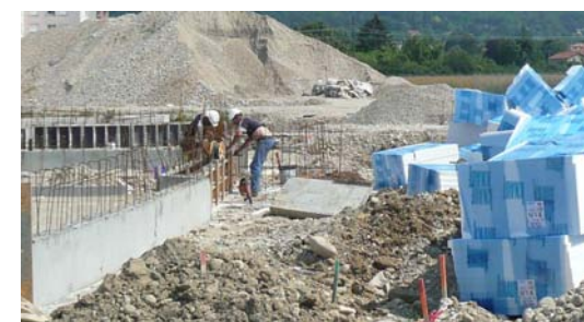
Pose des isolations sous les dalles et coffrage du hall d'entrée

Lamy/Bessard, chargé du gros œuvre, emploie 20 personnes sur le site. L'équipe « réseau » de Brunet compte 5 personnes. Cette semaine sont installées les isolations thermiques sous les dalles : il s'agit de polyester expansé.