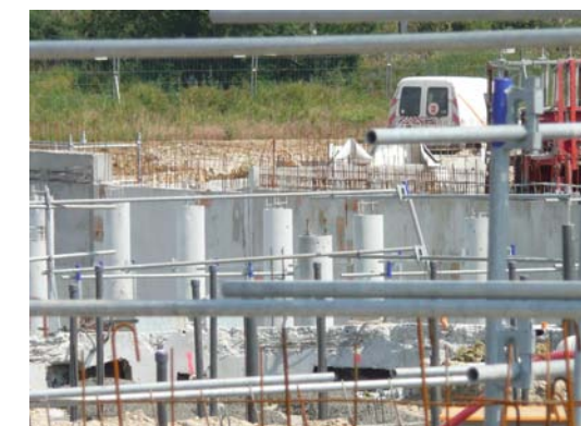
Les piliers de soutien ont tous été coulés

Le travail a commencé dans la zone 4 ( celle des futurs vestiaires) ; les bassins compétition et aquagym sont coulés, la partie bassin ludique le sera cette semaine et les ouvriers enchaîneront avec la partie zen. Parallèlement, tous les piliers sont coulés. Tout le gros œuvre sera fini en Octobre, les maçons laisseront la place aux charpentiers avant de revenir pour les aménagements extérieurs.