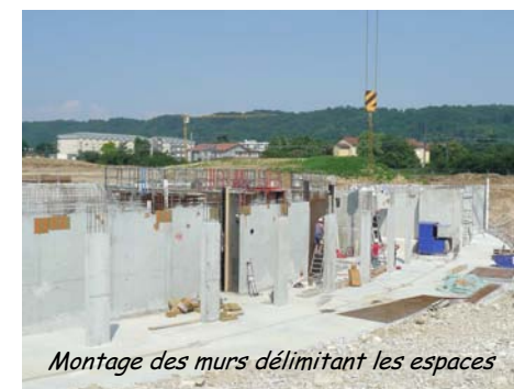
Montage des murs délimitant les espaces

Lundi 28 juin : J. 40 du chantier. Les délais sont respectés si bien que le chantier s'arrêtera les trois premières semaines d'août.