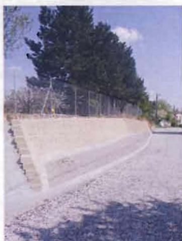
Les nouvelles places de parking

Les travaux ont enfin pu démarrer début novembre 2009 par l'enfouissement des réseaux