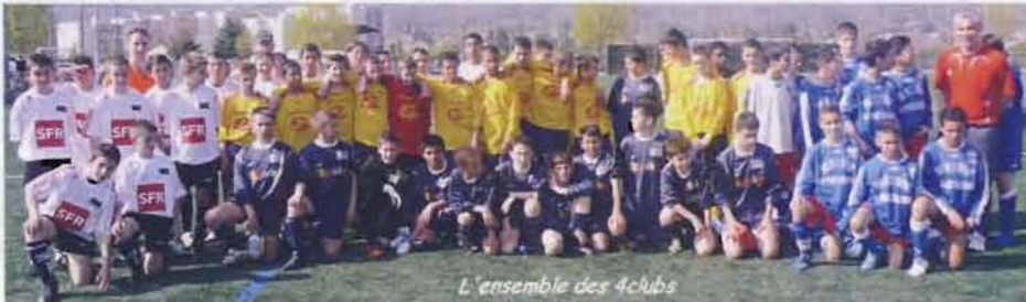
L'ensemble des 4 clubs

Profitant des vacances de Pâques, Ain Sud foot organise ses stages multi sports. Inscrits au P.E.L. mauricien, ces stages permettent aux jeunes licenciés du club de 7 à 12 ans de pratiquer pendant une semaine, leur sport préféré bien sûr mais aussi de découvrir d'autres disciplines. A Pâques, c'était le Badminton en collaboration avec la section de l' ULM. Toujours ludiques, ces stages affichent aussi le jorky ball ou le lazer game. Les enfants sont accueillis à la journée et les bénévoles du club prennent en charge les repas... entre 60 et 80 chaque jour.