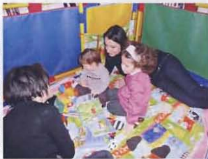
Découverte du livre sur le tapis d'éveil

Cochet ont été mobilisées : artistes des ateliers pour la réalisation d'un tapis d'éveil géant et la décoration des salles, adhérents pour la réalisation des mascottes girafe tortue et autres éléphants, jeunes acteurs des troupes ados et adultes pour la lecture à haute voix et la lecture de livres d'animations, conteuse, comité des lectrices pour la présentation des lots remis.