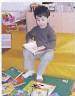
Spécial "grand frère" !

Le conseil d'administration s'est chargé du déménagement et de la réinstallation des locaux.