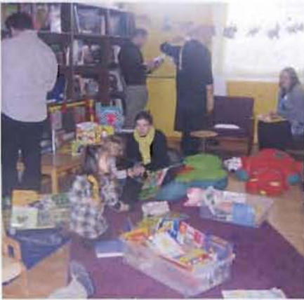
Livres en liberté

structure petite enfance étaient appelées à organiser une animation pour la remise des lots. Finalement, ce sont toutes les bibliothèques, les crèches halte garderies multi accueil, ludothèque et relais assistantes maternelles de la Côticière qui ont mené un projet commun, le samedi 30 janvier dernier.