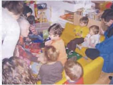
Lire en musique

Pour cette première expérience, test grandeur nature en vue d'une extension nationale l'an prochain, bibliothèque et