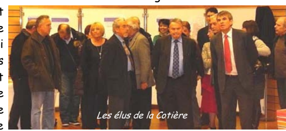
Les élus de la Côtère

Le monde économique ne fut pas oublié : "Je veux rendre hommage en ce début d'année, au monde économique de notre secteur. Dans une période où les commerces, les artisans et les