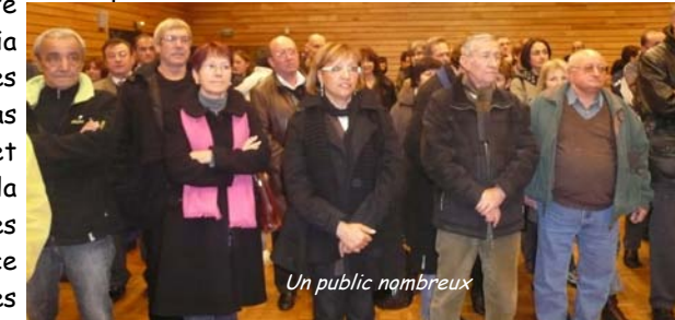
Un public nombreux

L'intervention se termina par un dernier remerciement au personnel communal et aux associations. Puis vint le moment des