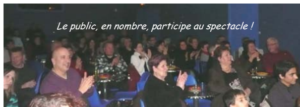
Le public, en nombre, participe au spectacle !