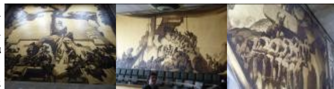
La salle espagnole : chaque mur représente une évolution (abolition esclavage avancée scientifique) ; le tableau au plafond, représente 5 géants (les 5 continents) réunis pour faire régner la paix.