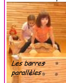
Les barres parallèles

bons) préparé par les bénévoles habituels du Centre Marcel Cochet permettait de prolonger la soirée en toute convivialité.