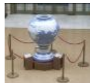
Le vase japonais

Le Siège de l'ONU est à New York mais de nombreux « commissariats » services sont répartis dans le monde comme la Cour de Justice de La Haye en Hollande. Genève accueille entre autres : le commissariat aux réfugiés, le Bureau International du Travail, l'Office Mondial de la Santé, le Secrétariat aux Droits de l'Homme Pendant notre visite avait lieu la conférence contre le Racisme. Si nous n'avons pas pu assister directement aux débats, on a pu le voir sur grand écran dans une salle multi média.