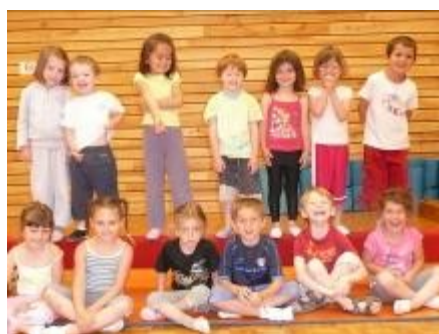
À 4 et 5 ans ; la gym ce n'est que du plaisir et de la bonne humeur

En juin la fête de la gym, une soirée à 18h30 pour les parents, les grands parents, présente un déroulé d'un cours de gym avec l'échauffement, le travail sur les différents agrès. Les plus grands présenteront un enchaînement chorégraphié. Les steppers et steppeuses des cours adultes seront aussi en démonstration.