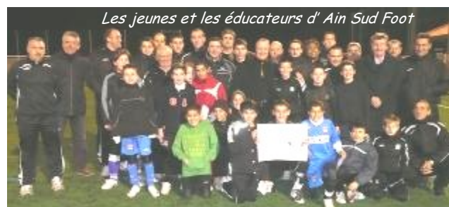
Les jeunes et les éducateurs d' Ain Sud Foot

Créé il y a 10 ans, il regroupe le foot de Neyron, Beynost Miribel et Saint Maurice. C'est le plus gros club de l'Ain avec 652 licenciés dont 430 jeunes de moins de 18 ans. 33 équipes en championnat dont 5 de niveau ligue. 40 éducateurs diplômés dont 7 brevets d'état.