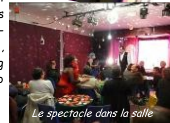
Le spectacle dans la salle