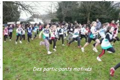
Des participants motivés