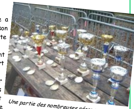
Une partie des nombreuses récompenses