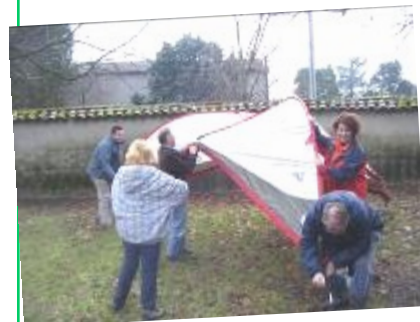
L'installation du matériel

Cette année encore, le Miribel Côtère Athlétisme a connu un vif succès lors de la 8ème édition de son cross des papillotes dans le Parc de la Sathonette aménagé pour l'occasion.