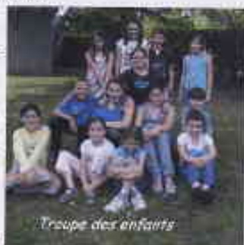
Troupe des enfants