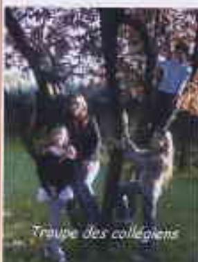
Troupe des collégiens

Les spectacles ont débuté fin mai avec le groupe des collégiens et 6 ème et 5 ème .